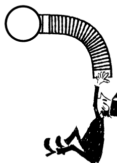
3. Passa in